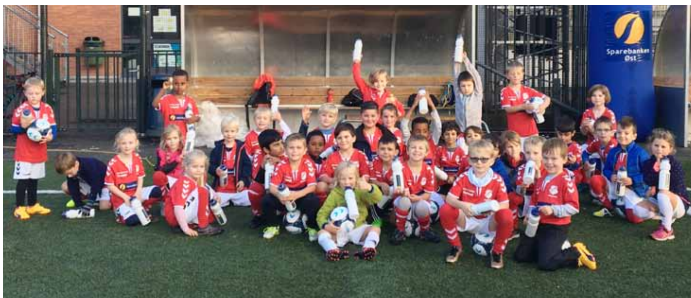
Neste generasjon: Årets deltakere på Skiold Fotballskole