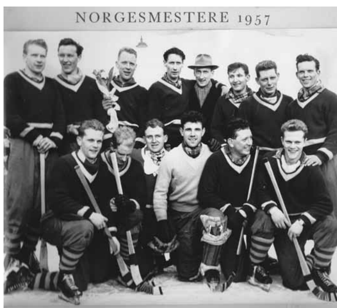
Skiolds norgesmestere i bandy 1957.