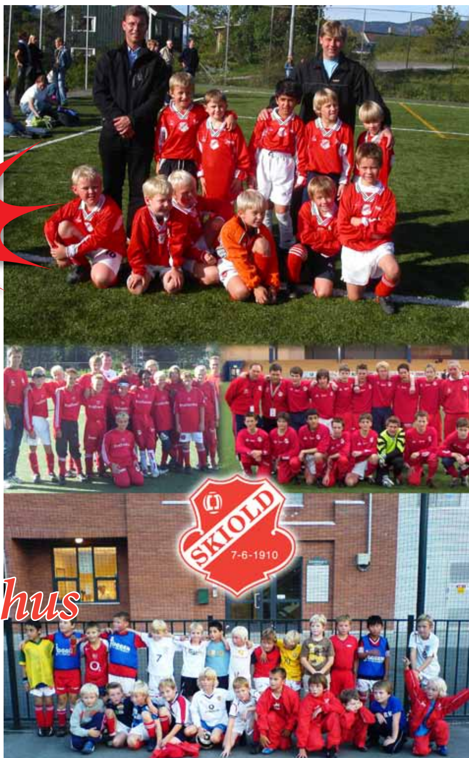
Bilde 1 Skiold G 1997 tatt i 2004, Bilde 2 fra venstre Skiold G1990 tatt i 2003, bilde 3 fra høyre Skiold G1988 Finale Nike Cup 2003 og nederste bilde Skiold G1998 tatt i 2006

Tiden har kommet Fortellinger fra fotballskolen