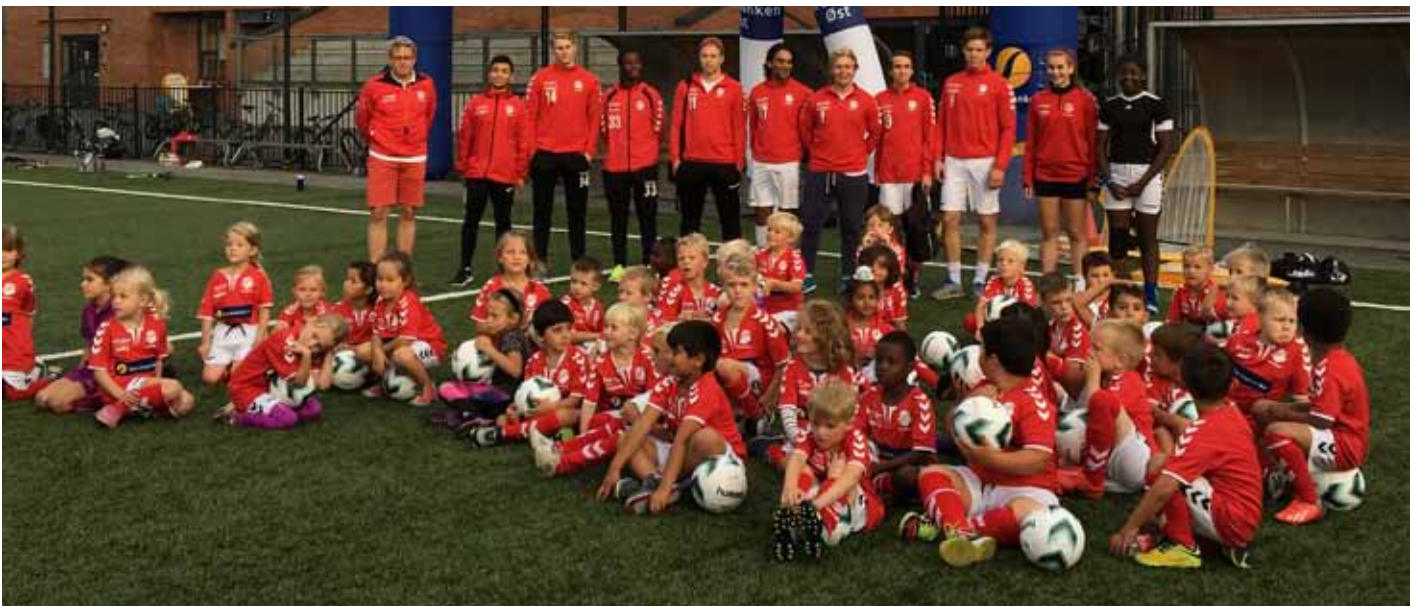
Neste generasjon: Årets deltakere på Skiold Fotballskole