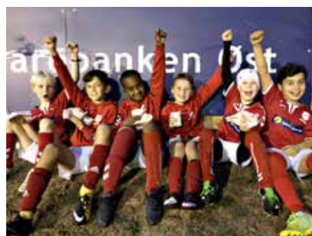
Bilder: Øverst til venstre: G2009 Danvik 1, Øverst til høyre 2009 Danvik 2, Nederst til venstre Gutter 2009 Danvik 3 og Nederst til høyre Danvik 2009 4.