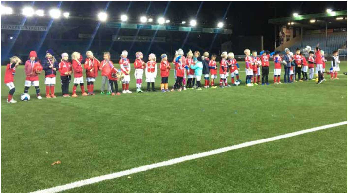
Neste generasjon: Årets deltakere på Skiold Fotballskole