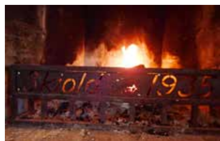
På kalde dager fyres det i peisen på Skioldhytta.