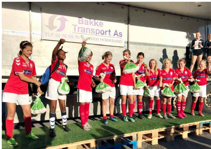
Jenter 2007 har vært med på både Helgerød cup og KIWI cup.

Superjentene har gjennomført nok en flott sesong! De er fortsatt en fin gjeng som nå består av 11 spillere. Godt humør, samhold og spillelede er stikkord som beskriver gjengen.