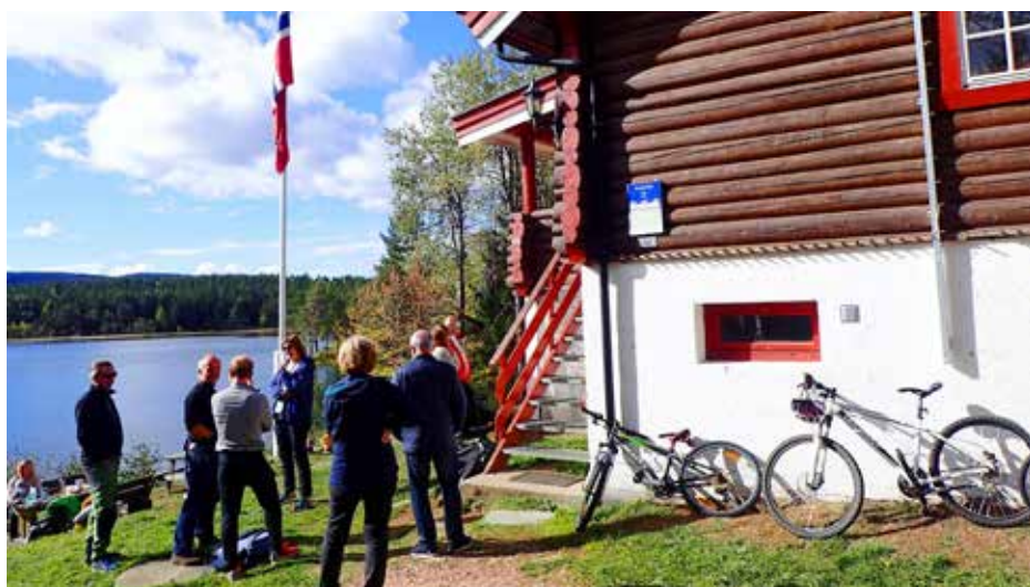
Skioldhytta er et attraktivt turmål i Konnerudmarka med sin flotte beliggenhet ved Steglevann.

Utgangspunktet for å komme seg inn til disse herlige traktene er flere. Folk flest starter nok turen fra Olsrud parkering, men noen går også inn fra Eikerdelet ved Ormetjern eller kommer østfra Konnerud eller vestfra MIF-hytta.