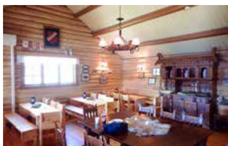
Det er trivelig innendørs i Skioldhytta også