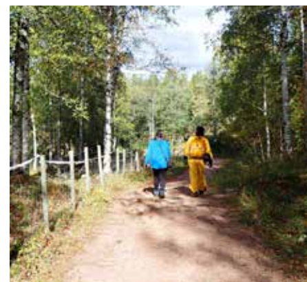
Turveiene mellom Skioldhytta, SIF-hytta og Olsrud parkering i Konnerudmarka er velegnet for både fotvandrere, barnevogner og syklist