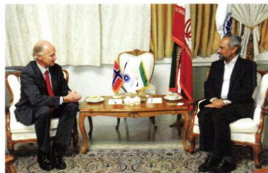
Med presidentens rådgiver/leder for arbeidsgiverforeningen