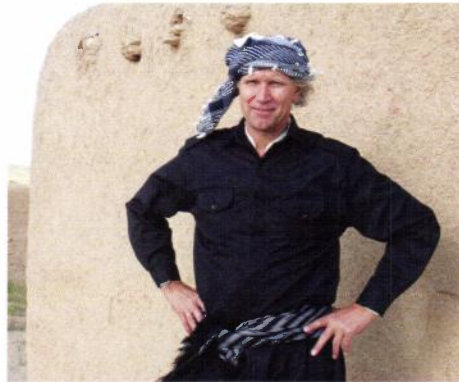
I iransk Kurdistan, med kurdisk nasjonaldrakt