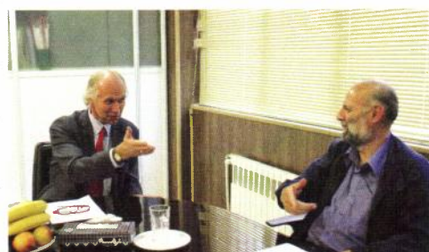
Med lederen for iransk LO

og USA's presidenter snakket sammen for første gang siden 1979, da amerikanske diplomater ble holdt fanget i 444 dager etter den islamske revolusjonen i Iran og president Jimmy Carter tapte presidentvalget som følge av dette. Jeg hadde for øvrig anledning til å diskutere dette med tidligere president Carter rett før jeg reiste til Iran da jeg hadde ham og FNs spesialutsending for Syria, Lakdar Brahimi på lunsj Iran preges i disse dager av enorme forventninger til den nye regjeringen. Selv om Iran er et rikt land merkes sanksjonene på økonomien. Nå ønsker landet å endre dette. I forbindelse med denne utviklingen har jeg kontakt med norsk næringsliv som tidligere var svært aktive i Iran, så som Statoil, Yara, Jotun, Det norske Veritas, Jordan m.fl. Med 75 millioner mennesker har Iran et stort potensielt marked for norske bedrifter. I tillegg til det politiske, og næringsliv søker vi også et engasjement på kultursiden. Vi håper å bidra til å sette opp «Ibsens kvinner» med norske skuespillere på en kulturfestival i Teheran i januar.