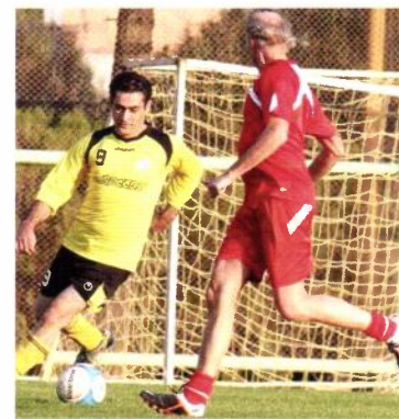
Gamle takter men hvor er leggskinnene?

Men livet er langt fra bare fotball, snarere det er ikke lett å få tid til en ukentlig kamp. Men jeg prøver å legge inn noen økter på treningsstudio i helgene og en tur i Alborz-fjellene bak Teheran, som når over 3.700 moh.