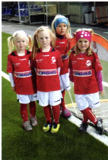
Flotte jenter på årets fotballskole