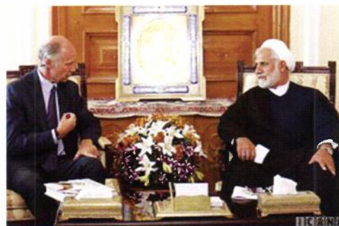
Med lederen i Utenrikskomiteen i det iranske parlamentet