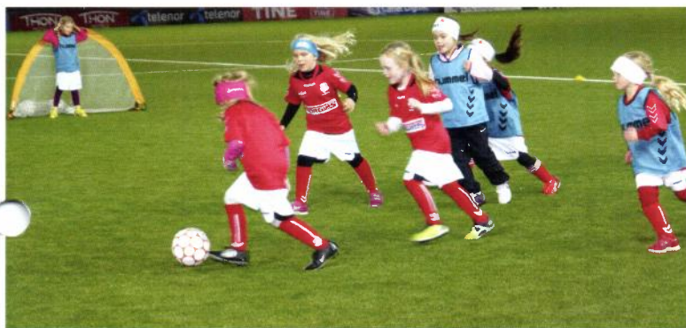
Stor innsats på Gamle Gress

DETTE RØRER IKKE VED DIN EVENTUELLE GEVINST - DET ER NORSK TIPPING SOM BETALER KONTAKT DIN TIPPEKOMMISJONÆR - VÅRT ORG.NR 983885144