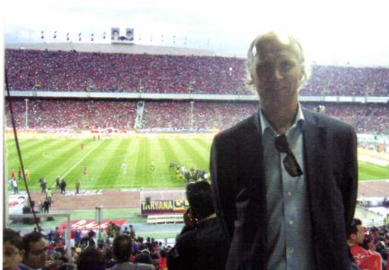
Fra den iranske cupfinalen 2012 Persepolis-Sepahan.

Jeg fikk også med meg den iranske cupfinalen i fjor høst med 100.000 på tribunen og enorm stemning. Persepolis tapte etter ekstraomganger og straffer, men det var en stor opplevelse. Jeg har hatt samtaler med fotballpresidenten for å prøve å få treningskamp mot Norge og om et samarbeid mellom Norges Fotballforbund og det iranske fotballforbundet om opplæring av trenere for kvinnefotball. To ganger i året kommer norske trenere til Iran for å lære opp iranske kvinnelige trenere.