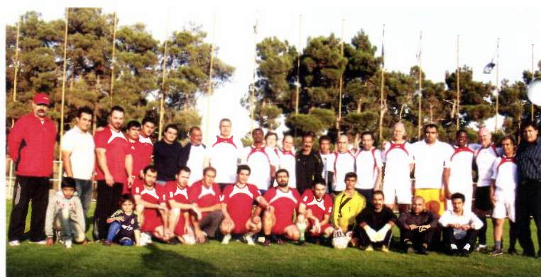
Her er et fotballbilde, «mitt» lag er de i hvite drakter med rødt skulderparti. Fra høyre Yemens ambassadør, FNs stedlige representant, Sudan (sønnen til ambassadøren), oppmann i gul bukse, JPK, tre tidligere iranske landslagsspillere, dommer, Spania, Hviterusland, Burundi og Algeries ambassadører. De røde var et motstanderlag mens politi, banemannskap, materialforvaltere mm utgjør de øvrige.

Jeg fikk også med meg den iranske cupfinalen i fjor høst med 100.000 på tribunen og enorm stemning. Persepolis tapte etter ekstraomganger og straffer, men det var en stor opplevelse. Jeg har hatt samtaler med fotballpresidenten for å prøve å få treningskamp mot Norge og om et samarbeid mellom Norges Fotballforbund og det iranske fotballforbundet om opplæring av trenere for kvinnefotball. To ganger i året kommer norske trenere til Iran for å lære opp iranske kvinnelige trenere.