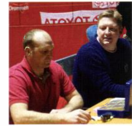
Foreldre i billettluke (2 gamle storspillere)