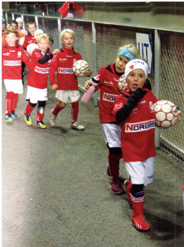
På vei til premieutdeling, legg merke til så fine de er med like drakter, bukser og strømper.