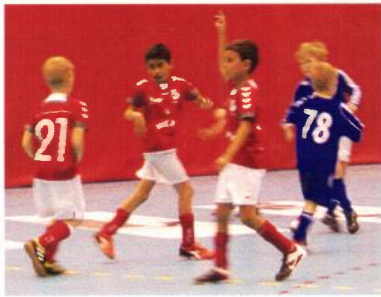
Full innsats i årets cup