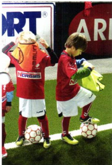
Ikke så lett å få på seg overtreksvester for første gang

Vi gleder oss til å se alle barn og foreldre på treninger og kamper utover våren.