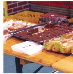
Deilig bakst, fra flinke foreldre