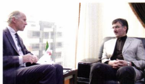
Med lederen for det iranske Oljefondet