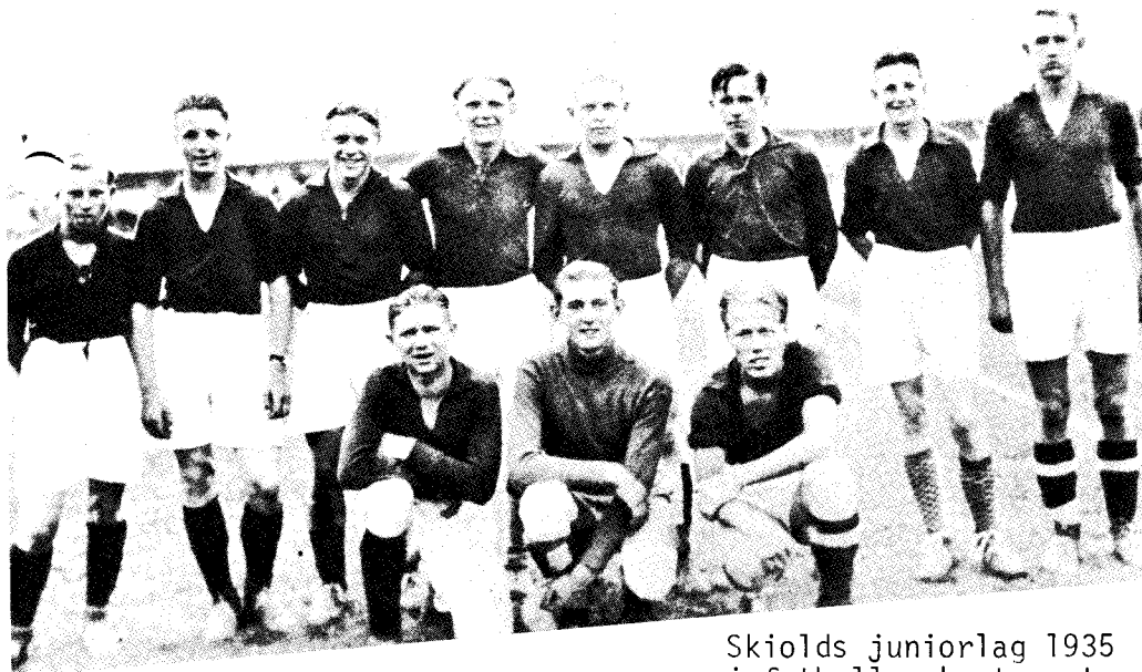
Skiolds juniorlag 1935 i fotball - kretsmestere